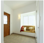
写真は当社リノベーション実例です

階段下を活用したシューズクロックを設置。踊り場を設けて安全性を高め、暗くなりちな玄関や中廊下は彩光にも配慮しました。