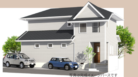
写真は完成イメージパースです

北欧テイストの美しいデザインと、木のナチュラルな温かみが、明るく、心地よい空間を演出。断熱性を大幅に改善し、毎日を健康に送ることができる「冬暖かく、夏は涼しい」快適な住まい。耐震性もアップし、家族の安全を守る強い家にリノベーションしました。