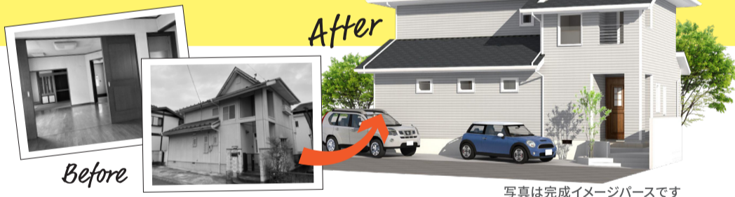
写真は完成イメージバースです

住み慣れたお家を生まれ変わらせるリノベーション。その魅力を存分に感じられるモデルハウスが仙台市にオープンします。仙台の厳しい冬・酷暑の夏でも快適に過ごせるよう断熱性能を向上、また暮らしやすい間取りに設計しました。私たち北洲の願いは、家づくりを通してご家族の安全で健康的な生活を実現すること。北洲の新しいモデルハウスに、ぜひ一度足を運んでみてください。