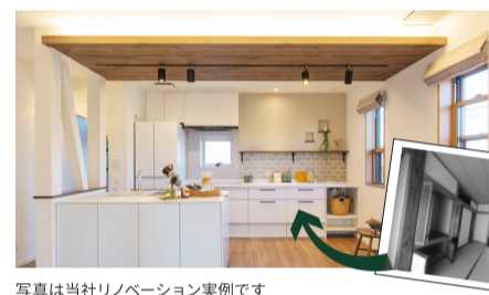
写真は当社リノベーション実例です

LDKは板張り天井が外とつながる開放的な空間。既存バルコニーの柱を活かした、「外」と「内」とをゆるやかにつなぐ中間領域をデザイン。