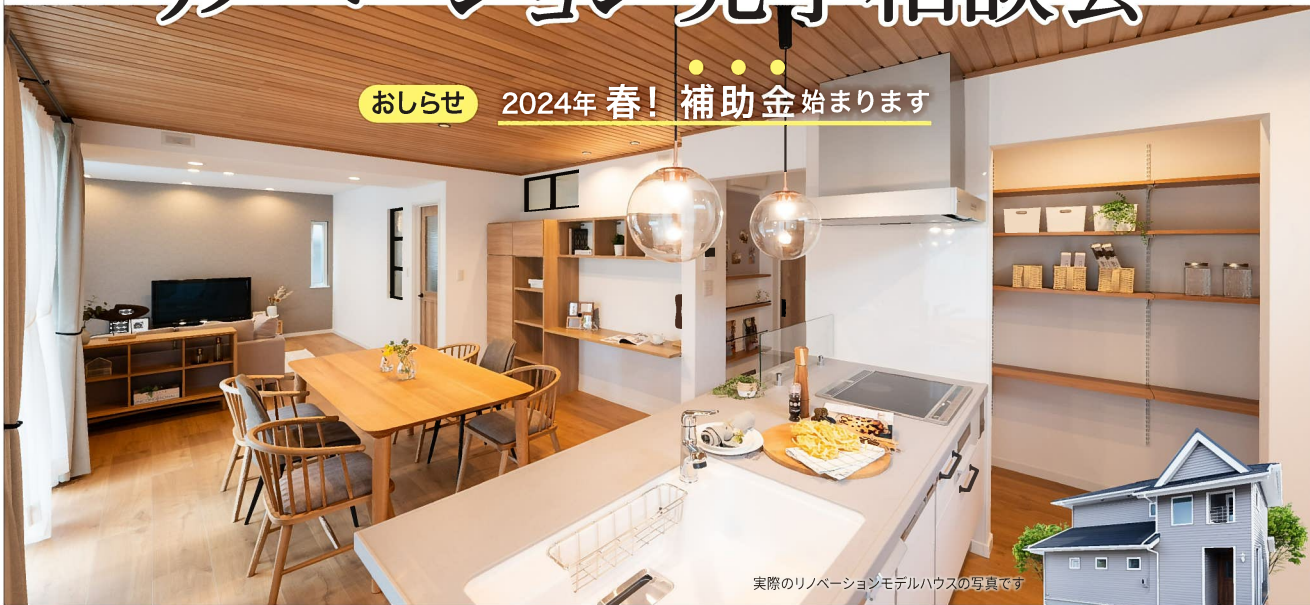
実際のリノベーションモデルハウスの写真です